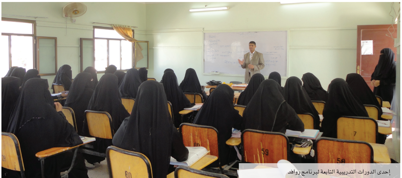
إحدى الدورات التدريبية التابعة لبرنامج روافد

بناء القدرات: تم خلال الفترة 25-31 مايو 2014 تنفيذ دورة تدريبية لمدة 6 أيام في مجال إدارة المشاريع لـ 23 ضابطاً من وحدات التدريب والزراعة والموروث الثقالي في الصندوق.