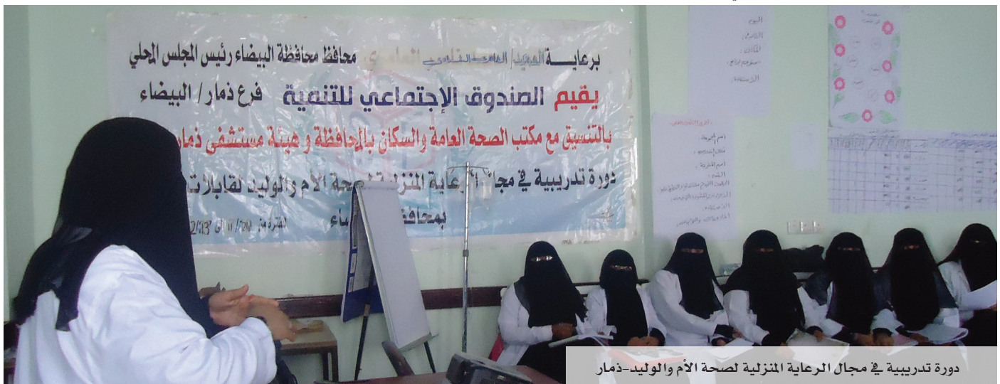
دورة تدريبية في مجال الرعاية المنزلية لصحة الأم والوليد-ذمار

ونفذ الصندوقُ دورتين تدريبيتين في مجال رعاية الخُدج وحديثي الولادة لسته أطباء و12 ممرضاً من مستشفى حرص والمستشفى الجمهوري (مدينة حجة).