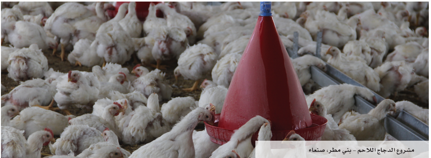
مشروع الدجاج اللاحم - بني مطر، صنعاء

ففي المكون الأول، يجري الاهتمام بتحسين مستوى وعمليات إدارة البذور بالاعتماد على المزارع، وإدخال وتوريد تقنيات خاصة بجمعيات منتجي البذور، وكذا الاهتمام بتوفير مخازن لجمعيات منتجي البذور، حيث يتم بناءً مخازن في المحافظات الخمس المستهدفة بسعة تخزينية إجمالية تبلغ 500 طن. كما يجري بناءً 18 خزناً للري التكميلي لمجموعات منتجي البذور في محافظة المحويت بسعة تخزينية إجمالية 945 متراً مكعباً.