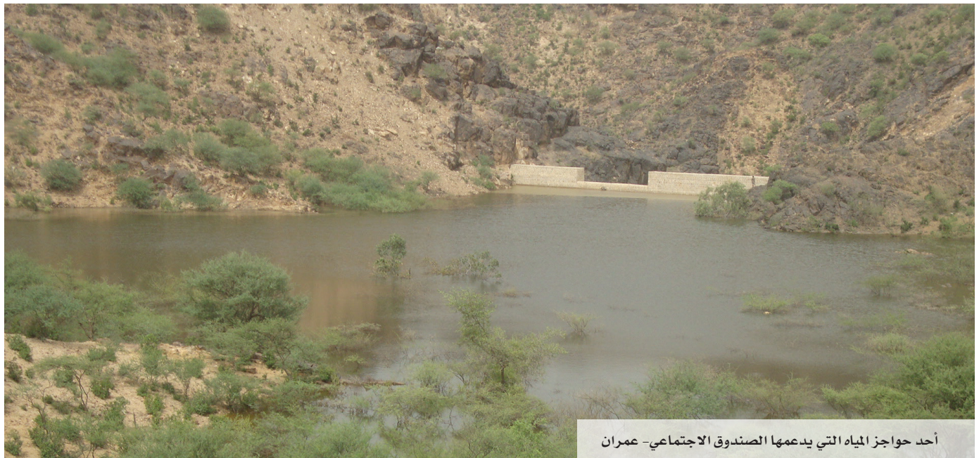
أحد حواجز المياه التي يدعمها الصندوق الاجتماعي - عمران